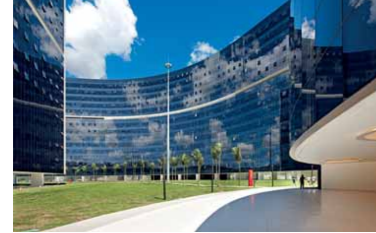
Cidade Administrativa Minas Gerais - Brazil 22.000 tende in vetrocamera ScreenLine 22,000 ScreenLine integrated blind systems

ScreenLine Benelux | ScreenLine BR | ScreenLine CZ | ScreenLine France | ScreenLine GmbH | ScreenLine Nordic | ScreenLine UK | ScreenLine Africa | ScreenLine India | ScreenLine Ibérica