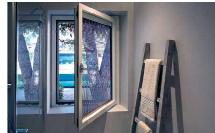
Residenza privata / Private house Tenda motorizzata ScreenLine su finestra ad un'anta ScreenLine motorised blind on casement window