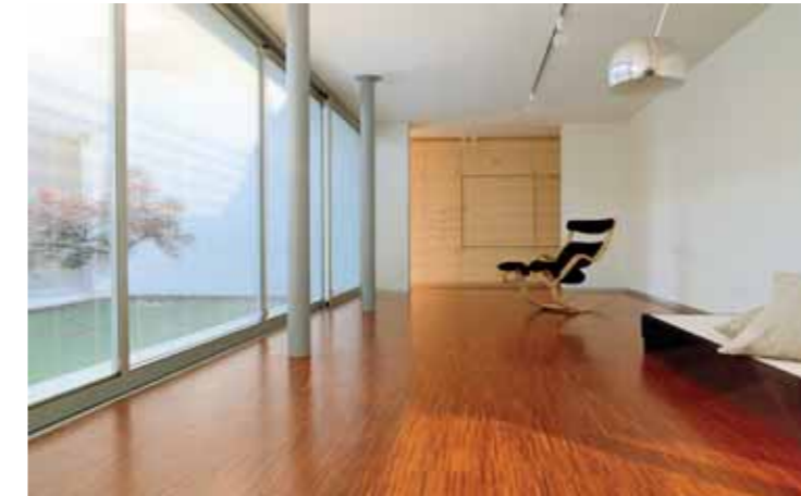
Residenza privata / Private house Tende ScreenLine su grandi serramenti scorrevoli ScreenLine blind systems on large sliding windows